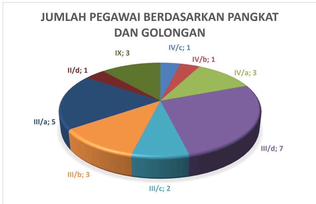
Gambar 1.2. Grafik Jumlah Pegawai Berdasarkan Pangkat dan Golongan