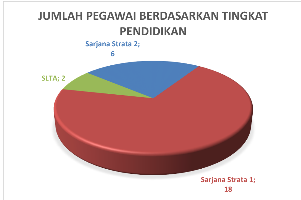
Gambar 1.1. Grafik Jumlah Pegawai Berdasarkan Tingkat Pendidikan