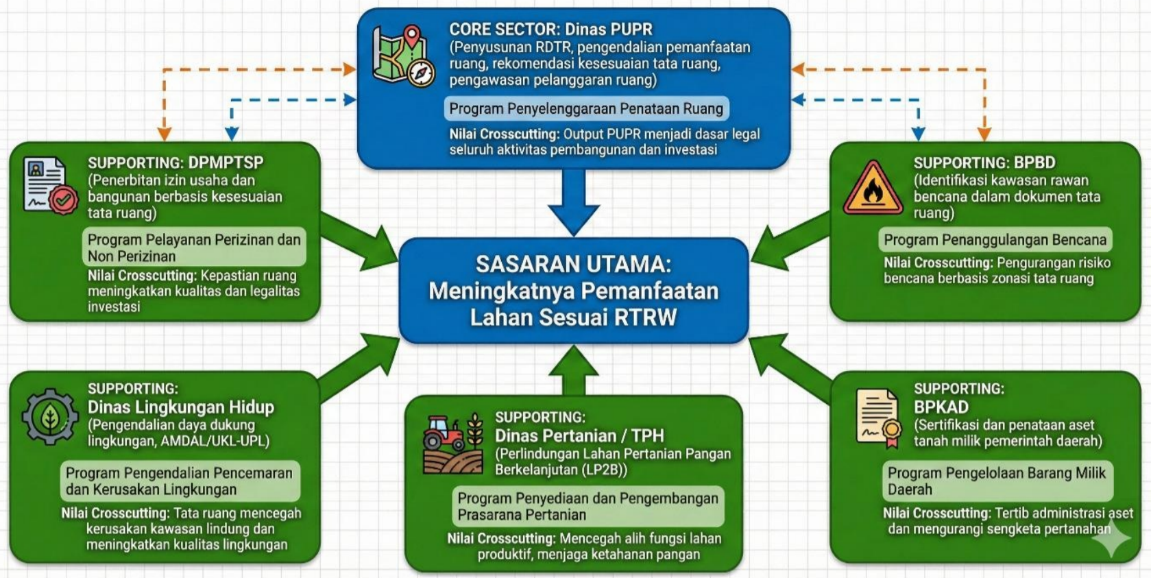
Diagram Grafis Crosscutting Sasaran: Meningkatnya Pemanfaatan Lahan Sesuai RTRW