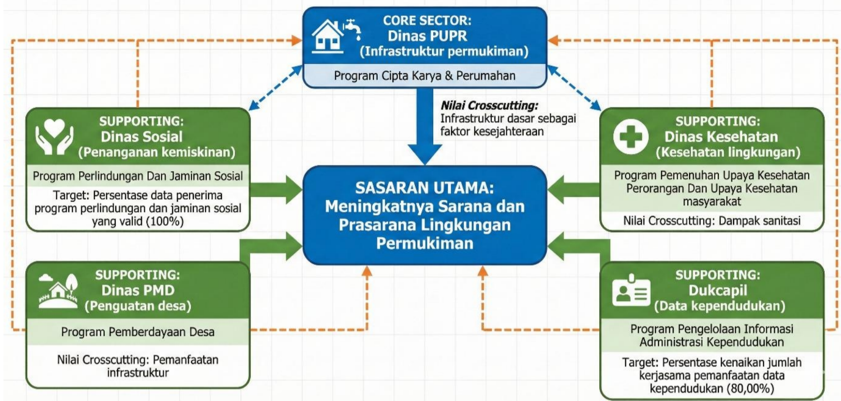
Diagram Grafis Crosscutting Sasaran: Meningkatnya Sarana dan Prasarana Lingkungan Permukiman